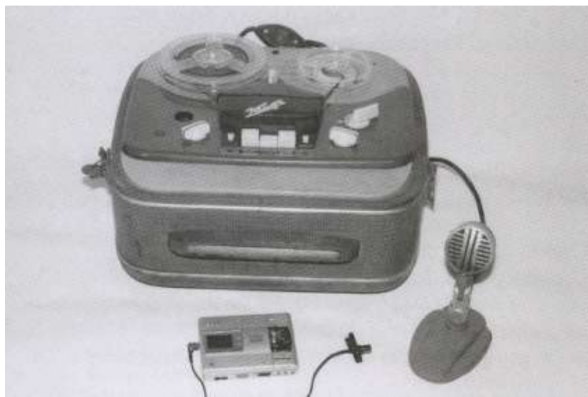
Magnetafons "Komēta" salīdzinājumā ar šodienas digitālo ierakstu magnetafonu ...